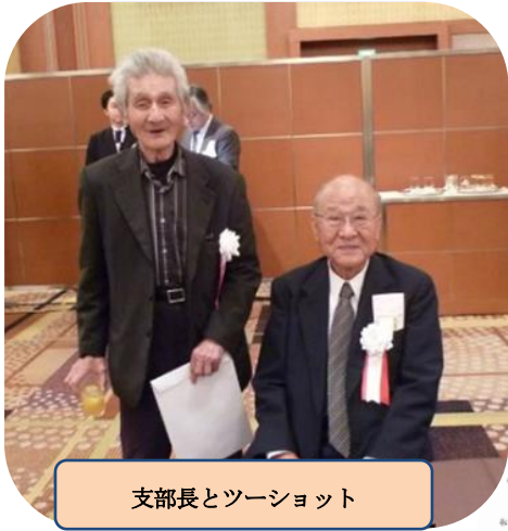
支部長とツーショット