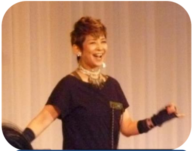
元ピンキーとキラーズ