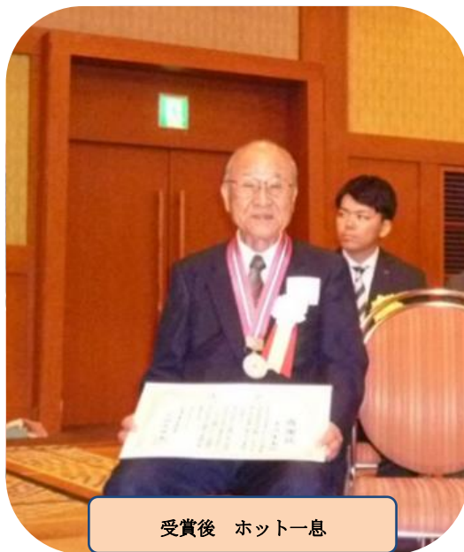
受賞後 ホット一息